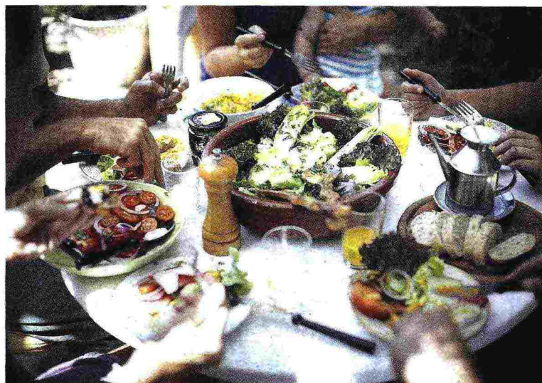
La dieta mediterranea è un grande contenitore da cui attingere i cibi più giusti per noi